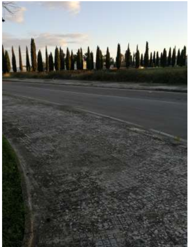
IP5 – Via Schiavo della Conca