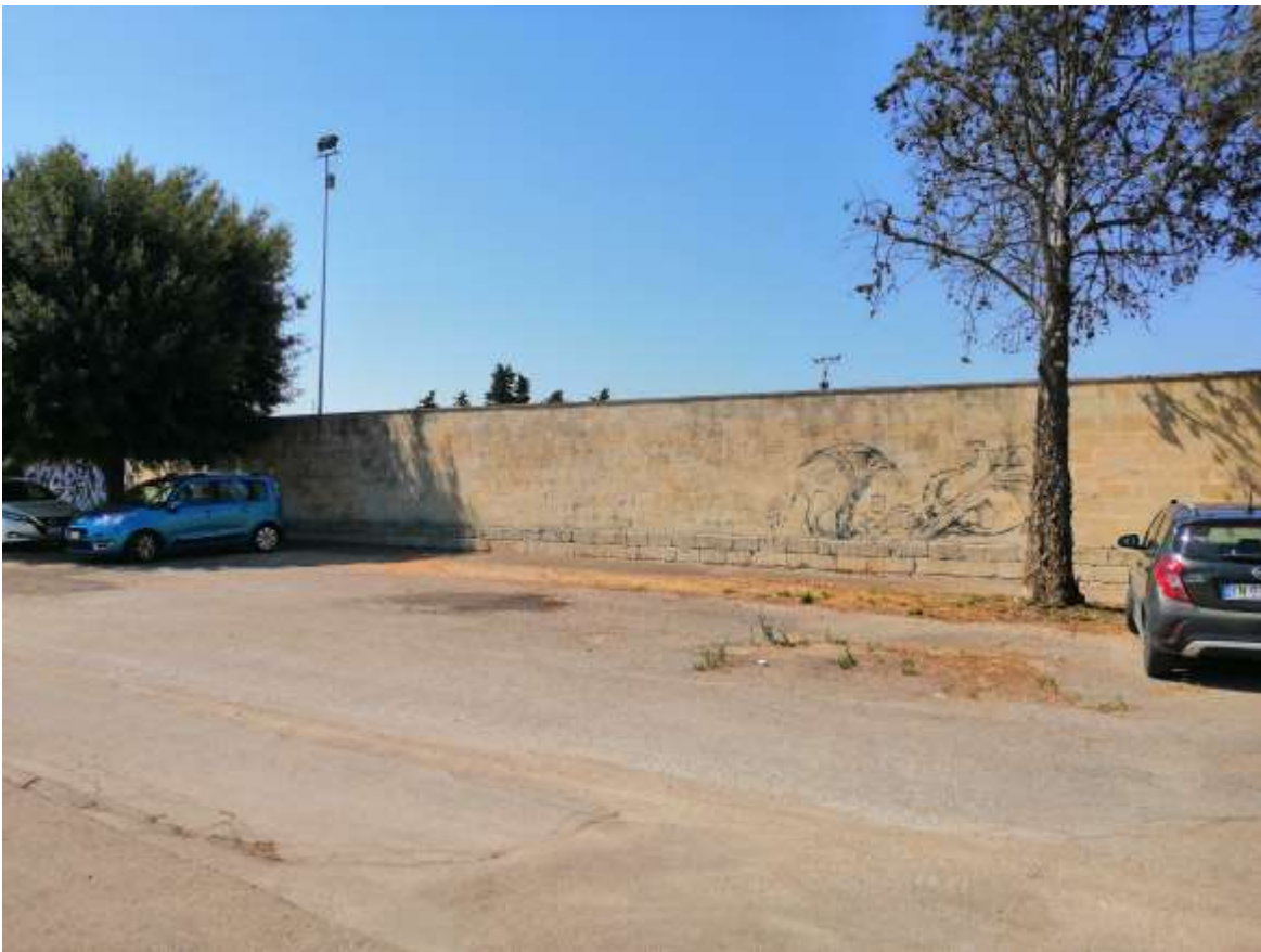
IP8 – Campo Sportivo