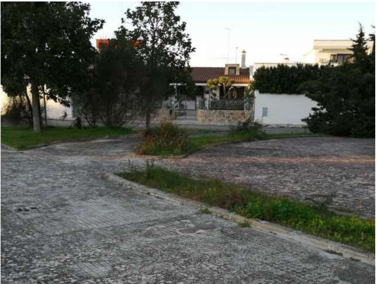
IP4 – Via Copertino