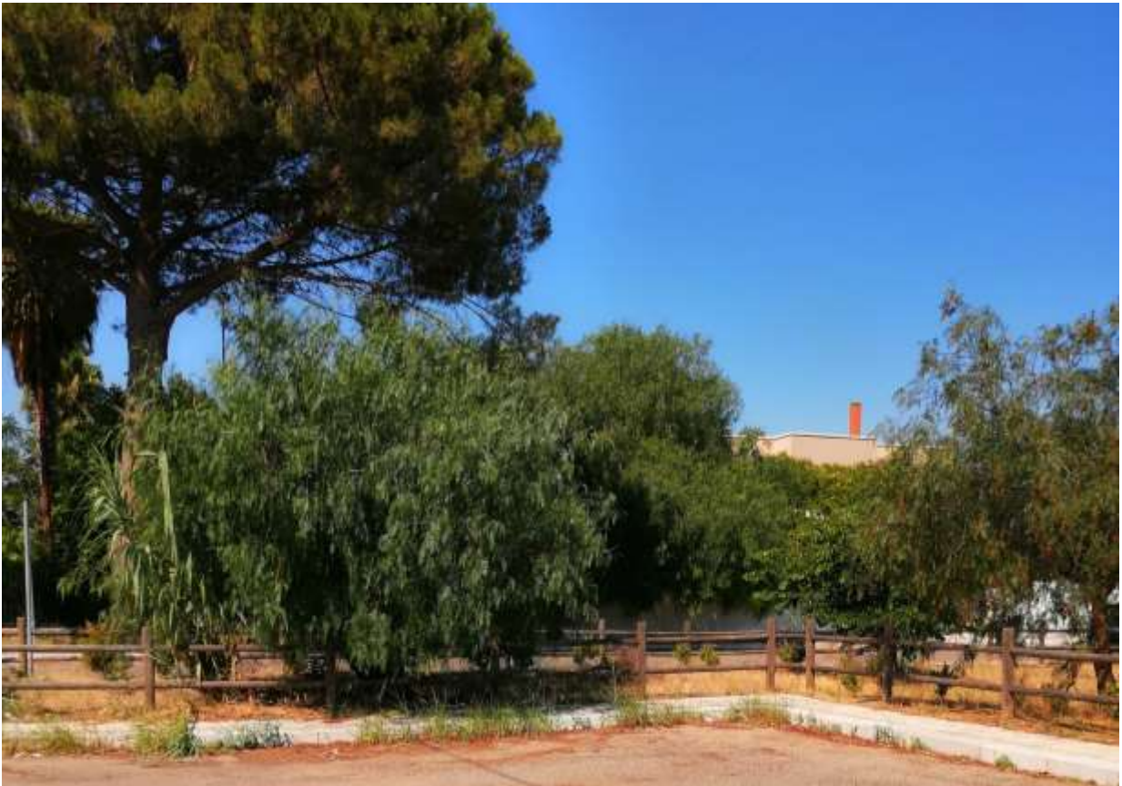
IP6 – Parco via Copertino