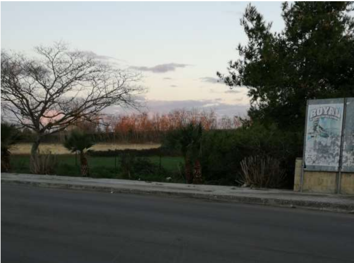
IP1 – Via P. Calamandrei