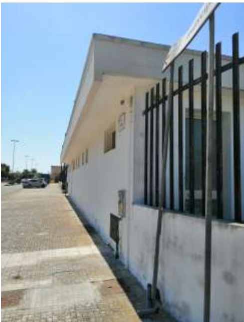
IP2 – Via A. Moro