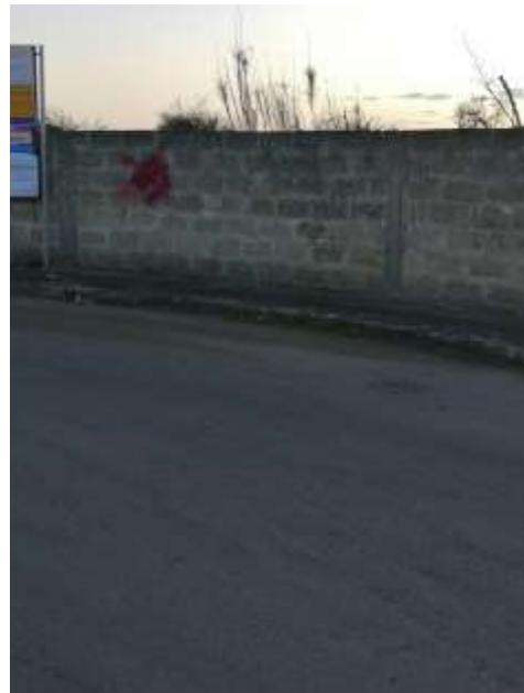
IP3 – Via G. Libertini Via S. D'Acquisto