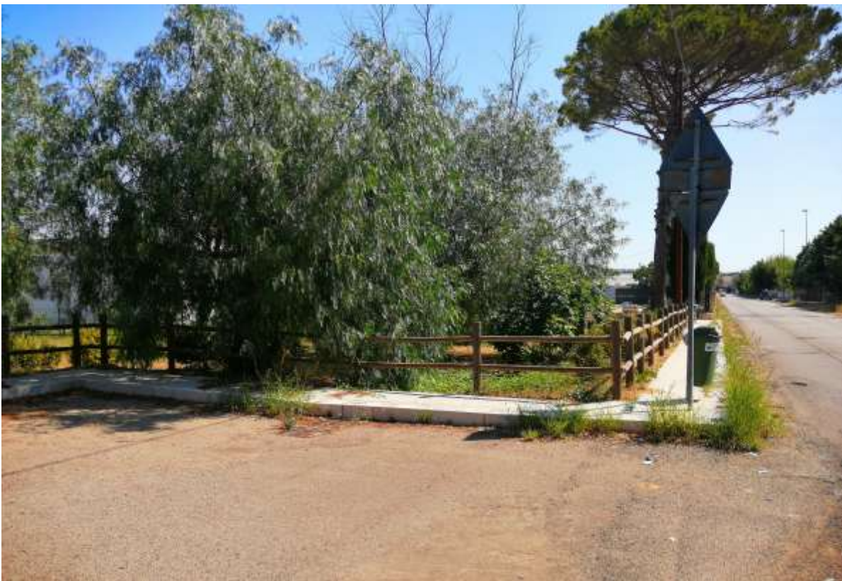
IP7 – Parco via Copertino