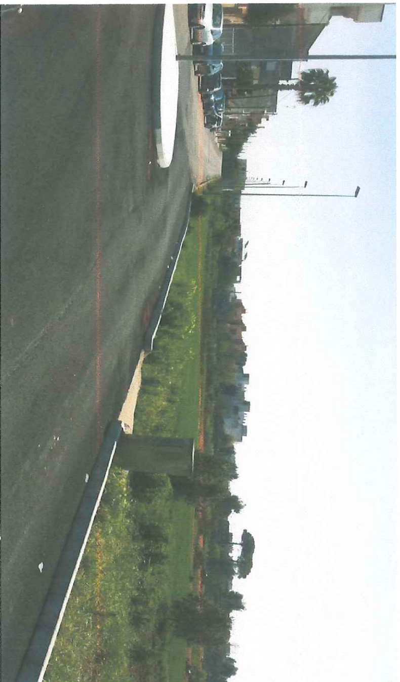
VISTA DI VIA NENNI E DEL LOTTO DALLA NUOVA STRADA LATO NORD