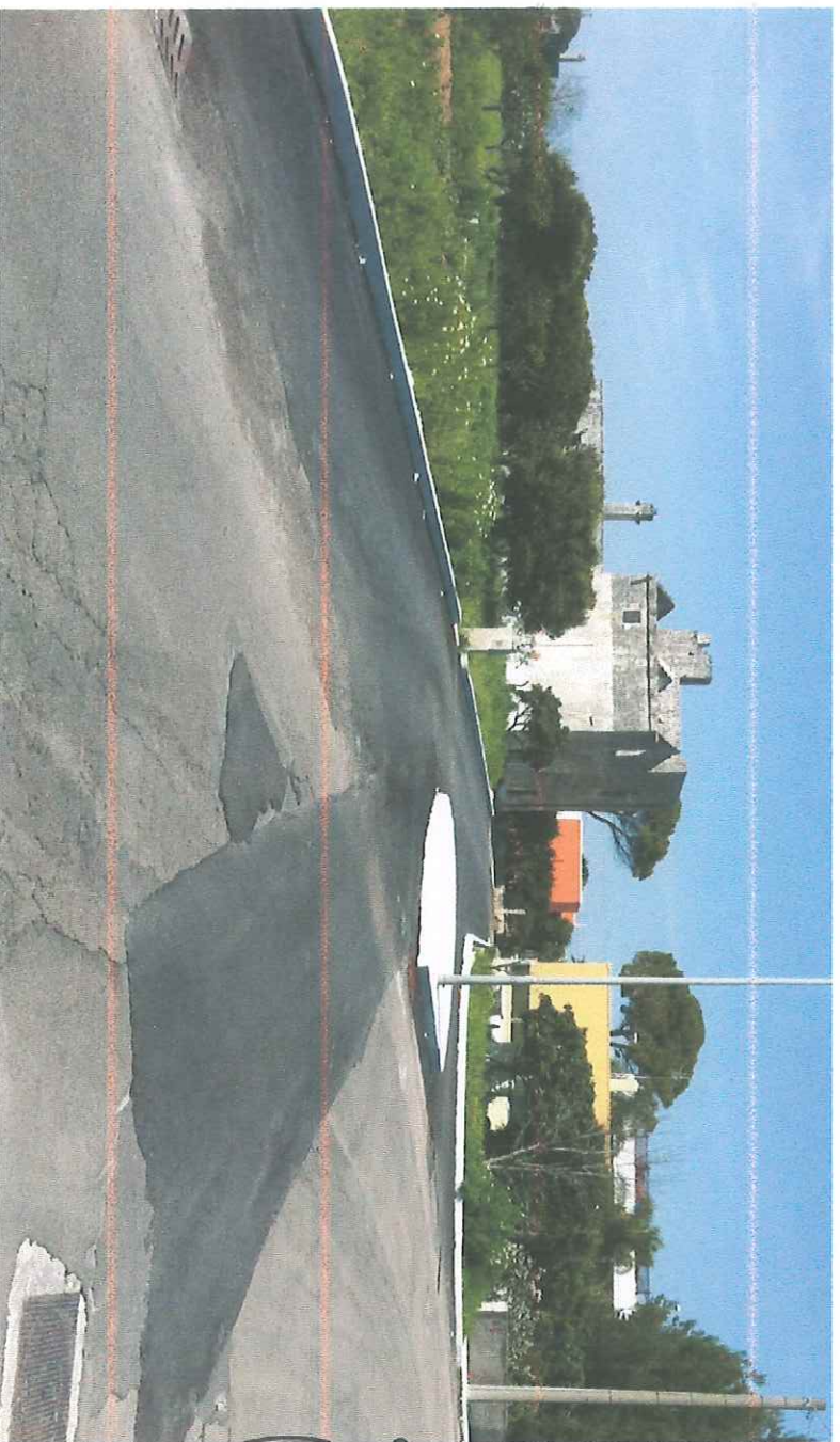
VISTA DELLA SISTEMAZIONE TRA VIA NENNI E NUOVA STRADA