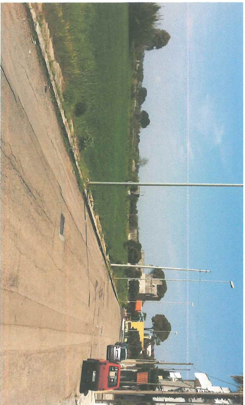
VISTA DEL LOTTO E DI VIA PIETRO NENNI