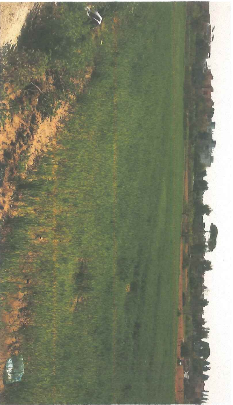
VISTA DEL LOTTO DA VIA PIETRO NENNI LATO NORD