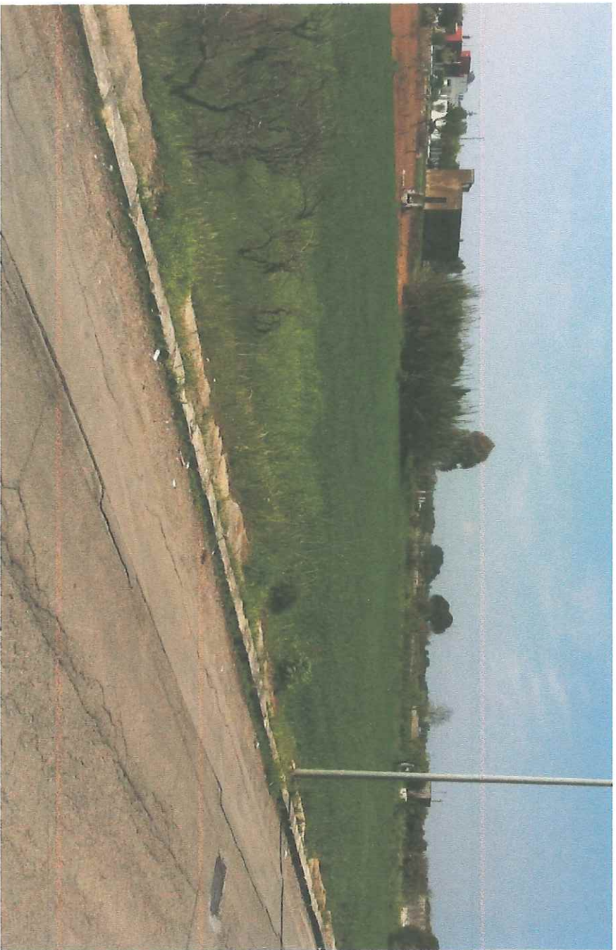
VISTA INTERNA DEL LOTTO