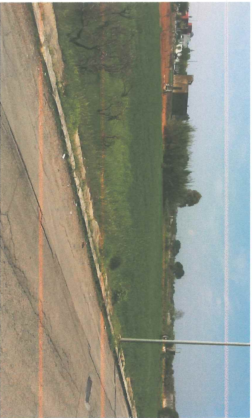
VISTA DEL LOTTO DA VIA PIETRO NENNI LATO SUD