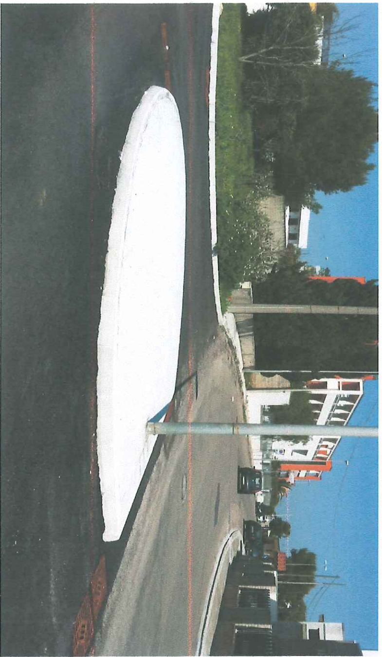
VISTA DELL' INCROCIO TRA VIA NENNI E NUOVA STRADA