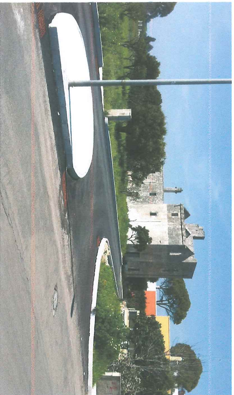
VISTA DELL' INCROCIO TRA VIA NENNI E NUOVA STRADA